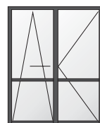
skrzydło uchylno - przesuwne UP